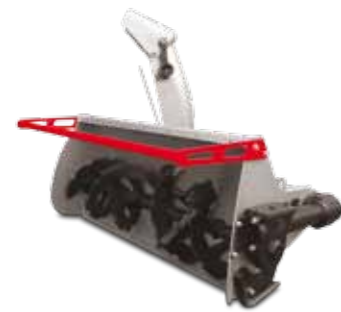
SPAZZANEVE BISTADIO A TURBINA