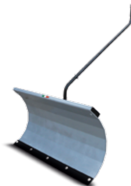
SPAZZANEVE A LAMA